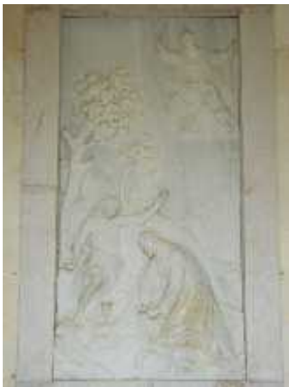
Jézus gyötrődése — dombormű a Gecsemáné kertben

... 40 Amikor visszament a tanítványokhoz, alva találta őket, és így szólt Péterhez: „Ennyire nem tudatok virrasztani velem egy órát sem? 41 Virrasszatok, és imádkozzatok, hogy kísértésbe ne essetek: a lélek ugyan kész, de a test erőtlens.” 42 Másodszor is elment, és így imádkozott: „Atyám, ha nem távozhat el tőlem ez a pohár, hanem ki kell innom, legyen meg a Te akaratod.” 43 Amikor visszament, ismét alva találta őket, mert elnehezült a szemük. 44 Othagyta őket, újra elment, harmadszor is imádkozott ugyanazokkal a szavakkal. 45 Azután visszatért a tanítványokhoz, és így szólt hozzájuk: „Aludjatok tovább és pihenjete! Íme, eljött az óra, és az Emberfia bűnösök kezébe adatik. 46 Ébredjete, menjünk! Íme, közel van az, aki engem elárul.”