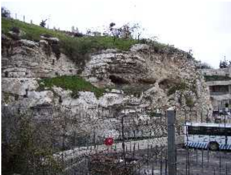
Koponyára hasonlító hegy Jeruzsálemben az anglikán egyház sírkertje mellett

(A keresztre feszítés protestánsok által feltételezett helyszíne)