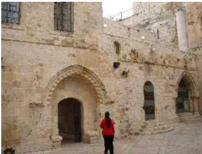
Kapubejárat az utolsó vacsora (hagyomány szerinti) színhelyé- hez a jeruzsálemi zsidó negyedben