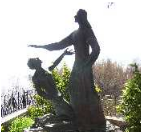
Péter rehabilitációja (Jn 21.)

(Szobor Tabghában a Galileai tó partján, a Primátus kápolna mögött)