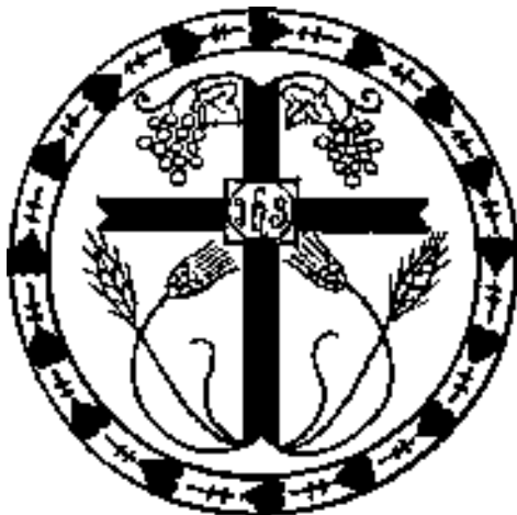
Jézus a szőlőtő

égetik. 7 Ha megmaradtok énbennem, és beszédeim megmaradnak ti-bennetek, akkor bármit akartok, kérjétek, és megadatik nektek. 8 Az lesz az én Atyám dicsősége, hogy sok gyümölcsöt teremtek, és akkor a tanítványaim lesztek.”