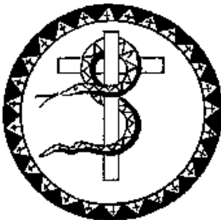
Jézus az Ószövetségben