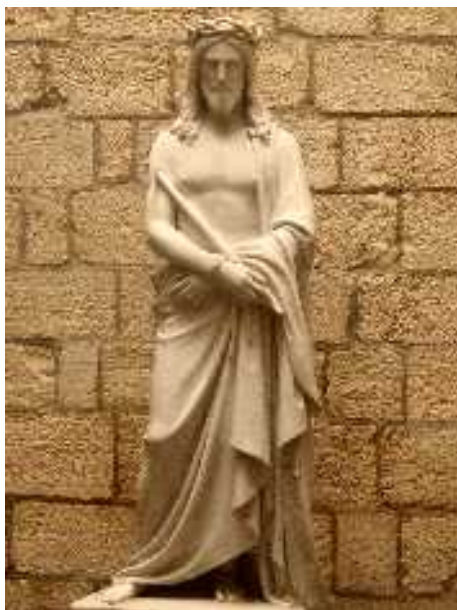
Via Dolorosa, II. stáció: Ecce homo (Íme az ember!) szobor

19 1 Akkor Pilátus elvitette Jézust, és megkorbácsoltatta. 2 A katonák tövisből koronát fontak, a fejére tették, és bíborruhát adtak Rá; 3 odajárultak Hozzá, és ezt mondták: „Üdvözlégy, zsidók királya!” — és arcul ütötték. 4 Pilátus ismét kiment az épület elé, és így szólt hozzájuk: „Íme, kihozom őt nektek. Tudjátok meg, hogy semmiféle bűnt nem találok benne.” 5 Ekkor kijött Jézus az épület elé, Rajta volt a töviskorona és a bíborruha. Pilátus így szólt hozzájuk: „Íme, az ember!”