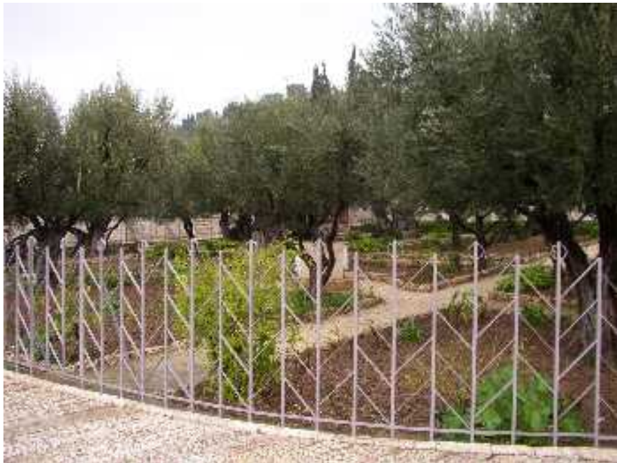
A Gecsemáné kert Jeruzsálemben