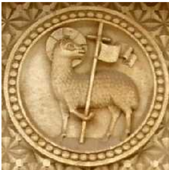
Bárány Krisztus, Aki életét áldozta, de győzött a halál felett — Dombormű a jeruzsálemi evangélikus templom bejárata felett

Szenháromság, dicsérjenek, / Üdvösség kútja, mindenek! Legyen győzelmünk, add meg ezt, / A diadalmas szent kereszt!