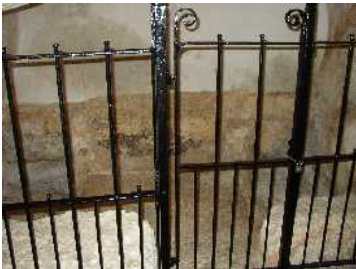
A jeruzsálemi Sírkertben található sírhely

(Jézus sírjának protestánsok által feltételezett helye)