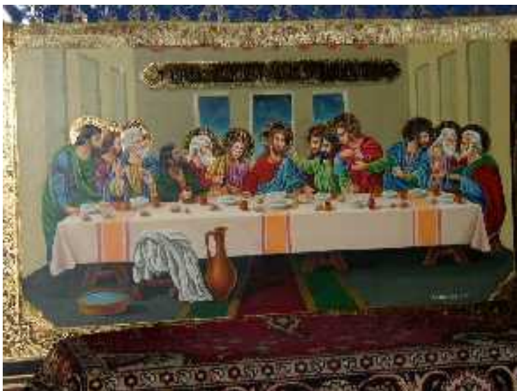
Az utolsó vacsora: „vajon kiről beszél?” (Festmény a jeruzsálemi Mária sírja templomban)

21 Miután ezeket elmondta Jézus, megrendült lelkében, és bizonyosságot tett e szavakkal: „Bizony, bizony, mondom néktek, közületek egy elárul engem.” 22 Zavartan néztek egymásra a tanítványok: vajon kiről beszél? 23 Jézus mellett telepedett le egyik tanítványa, akit Jézus szeretett. 24 Intett neki Simon Péter, hogy tudakolja meg, ki az, akiről beszél? 25 Az ráhajolt Jézus keblére, és megkérdezte Tőle: „Uram, ki az?” 26 Jézus így felelt: „Az, akinek én mártom be a falatot, és odaadom.” Bemártotta tehát a falatot, és odaadta Júdás Iskáriótesnek, a Simon fiának; 27 és akkor a falat után belement Sátán. Jézus pedig így szólt hozzá: „Amit tenni szándékozol, tedd meg hamar!” 28 Az ott ülők közül senki sem értette, hogy miért mondja ezt neki. 29 Egyesek ugyanis azt gondolták, hogy mivel az erszény Júdásnál volt, azt mondja neki Jézus: „Vedd meg, amire szükségünk van az ünnepre”, vagy azt, hogy a szegényeknek adjon valamit. 30 Miután tehát elfogadta a falatot, azonnal kiment. Már éjszaka volt.