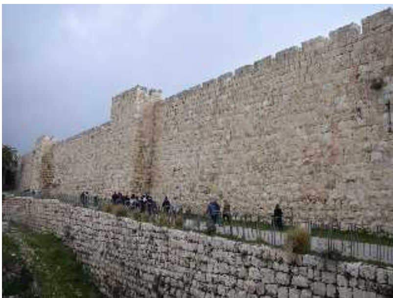
Jeruzsálem városfalának egy részlete