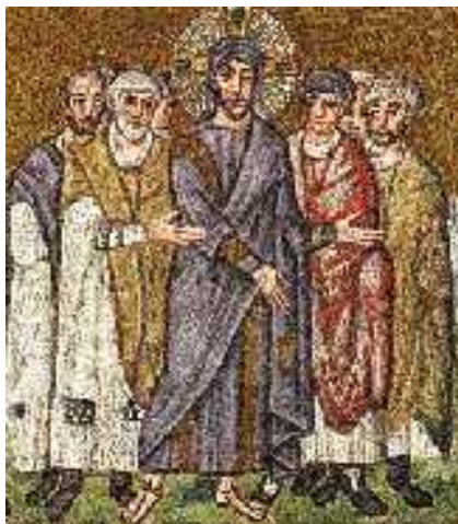
Jézus Heródes előtt — mozaik

8 Amikor Heródes meglátta Jézust, nagyon megörült, mert már jó ideje szeretne volna látni, mivel halott róla, és azt remélte, hogy valami csodát tesz majd az ő szeme láttára. 9 Hosszasan kérdezgette Őt, de Jézus semmit sem válaszolt neki. 10 Ott álltak a főpapok és az írástudók is, akik hevesen vádolták. 11 Heródes pedig katonai kíséretével együtt megvetően bánt vele, kigúnyolta, és fényes ruhába öltöztetve visszaküldte Pilátushoz. 12 Ezen a napon Heródes és Pilátus barátságot kötöttek egymással. Előtte ugyanis haragban voltak.