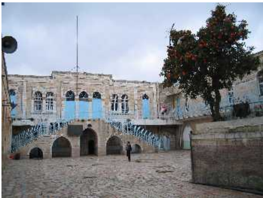
Via Dolorosa, I. stáció: Az Antonia torony, Pilátus székhelye (Jelenleg arab iskola, az Omariyeh kollégium)