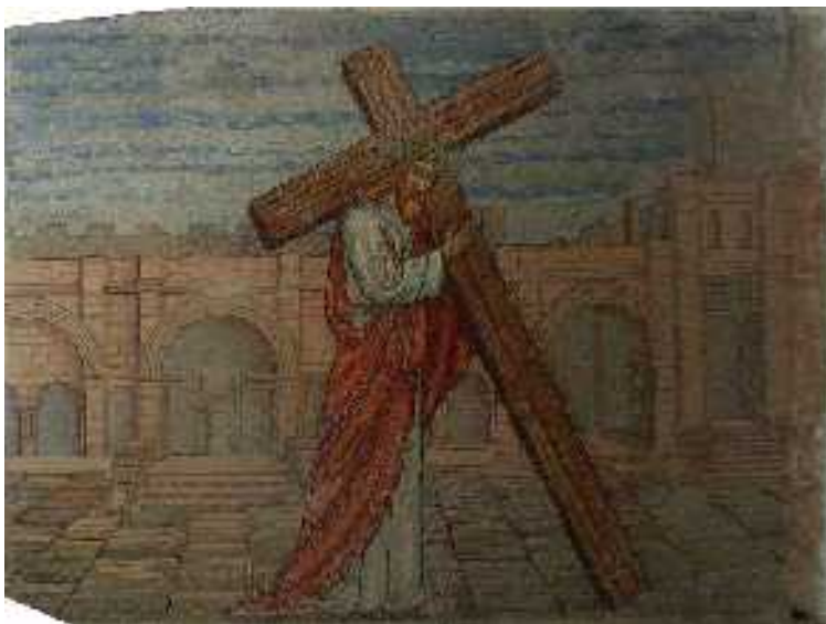
Via Dolorosa, II. stáció: Jézus elítélése — mozaik A Kövezett-udvarban

ta, még nagyobb félelem szállta meg. 9 Ismét bement a helytartóságra, és megkérdezte Jézust: „Honnan való vagy te?” De Jézus nem felelt neki. 10 Pilátus ekkor így szólt Hozzá: „Nekem nem felelsz? Nem tudod, hogy hatalmam van arra, hogy szabadon bocsássalak, de hatalmam van arra is, hogy megfeszíttesselek?” 11 Jézus így válaszolt: „Semmi hatalmad nem volna rajtam, ha felülről nem adatott volna neked: ezért annak, aki engem átadott neked, nagyobb a bűne.” 12 Ettől fogva Pilátus igyekezett Őt szabadon bocsátani, de a zsidók így kiáltottak: „Ha őt szabadon bocsátod, nem vagy a császár barátja: aki királlyá teszi magát, az ellene szegül a császárnak.” 13 Amikor Pilátus meghallotta ezeket a szavakat, kihozatta Jézust az épület elé, és a bírói székbe ült azon a helyen, amelyet Kövezett-udvarnak, héberül pedig Gabbatának neveztek. 14 A húsvétra való előkészület napja volt, délfelé járt az idő. Pilátus így szólt a zsidókhöz: „Íme, a ti királyotok!” 15 Azok pedig felkiáltottak: „Vidd el, vidd el, feszítsd meg!” Pilátus ezt mondta nekik: „A ti királyotokat feszítem meg?” A főpapok így válaszoltak: „Nem királyunk van, hanem császáruk!” 16 Ekkor kiszolgáltatta Őt nekik, hogy megfeszítsék.