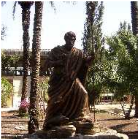
Péter szobra Kapernaumban