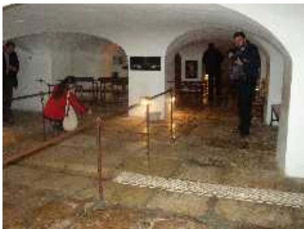
Via Dolorosa, II. stáció: A Kövezett-udvar (Lithostrotos), az ítélkezés csarnoka (A hajdani utcaszint most az épület alagsorában tekinthető meg)

6 Amint meglátták Jézust a főpapok és a szolgák, így kiáltottak: