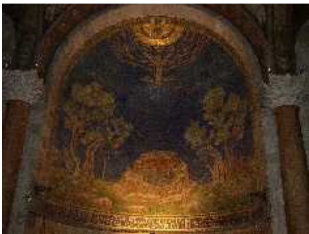
Jézus gyötrődik a Gecsemánében — falfestmény a jeruzsálemi Kinszenvedés templomában

... [ 43 Ekkor angyal jelent meg neki a mennyből, és erősítette Őt. 44 Halálos gyötrődésében még kitartóbban imádkozott, és verejtéke olyan volt, mint a földre hulló nagy vércseppek.]