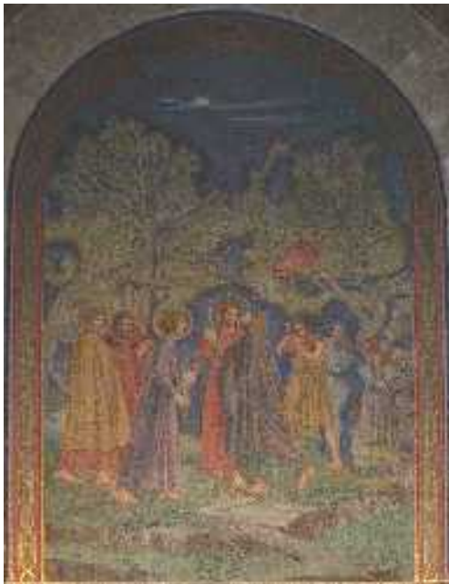
Júdás csókja — festmény a jeruzsálemi Kinszenvedés templomában

... 50 Jézus ezt mondta neki: „Barátom, hát ezért jöttél!” Akkor odamentek, rátették a kezüket, és elfogták. 51 Egy pedig azok közül, akik Jézussal voltak, kardjához kapott, kirántotta, lecsapott a főpap szolgájára, és levágta a fülét. 52 Ekkor így szólt hozzá Jézus: