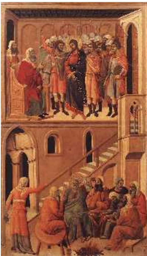
Jézus Annás előtt és Péter megtagadja Jézust

19 A főpap pedig tanítványai és tanítása felől kérdezte Jézust. 20 Jézus így válaszolt neki: „Én nyilvánosan szóltam a világhoz: én mindig a zsinagógában és a templomban tanítottam, ahol a zsidók mindannyian összejönnek, titokban nem beszéltem semmit. 21 Miért kérdezel engem? Kérdezd meg azokat, akik hallották, mit beszéltem nekik: íme, ők tudják, mit mondtam.” 22 Amikor ezt mondta, az ott álló szol-