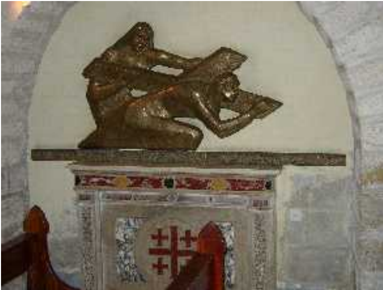
Via Dolorosa, V. stáció: Cirénei Simon — dombormű a stáció kápolnájában