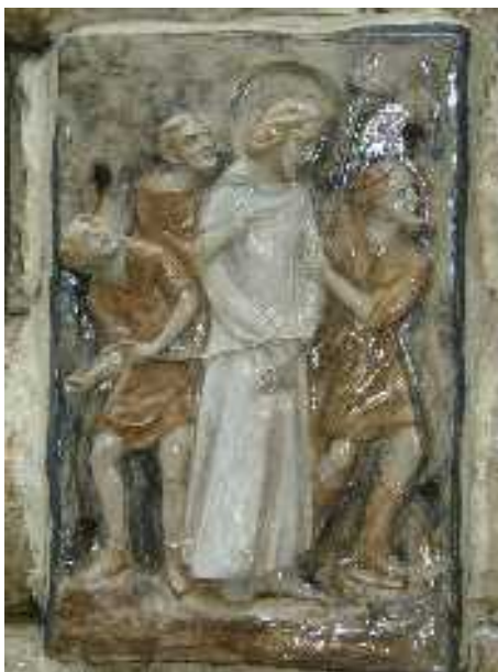
Jézus elfogatása — dombormű a Gecsemáné kertben

„Tedd vissza kardodat a helyére, mert akik kardot fognak, kard által vesznek el. 53 Vagy azt gondolod, hogy nem kérhetném meg Atyámat, hogy adjon mellém most tizenkét sereg angyalnál is többet? 54 De mi-képpen teljesednének be akkor az Írások, hogy ennek így kell történnie?” 55 Abban az órában így szólt Jézus a sokasághoz: „Úgy vo-nultatok ki, mint valami rabló ellen, kardokkal és botokkal, hogy el-fogjatok; mindennap a templomban ültem és tanítottam, mégsem fog-tatok el.” 56 Mindez pedig azért történt, hogy beteljesedjenek a prófé-ták írásai. Akkor a tanítványok mind elhagyták Őt, és elfutottak.