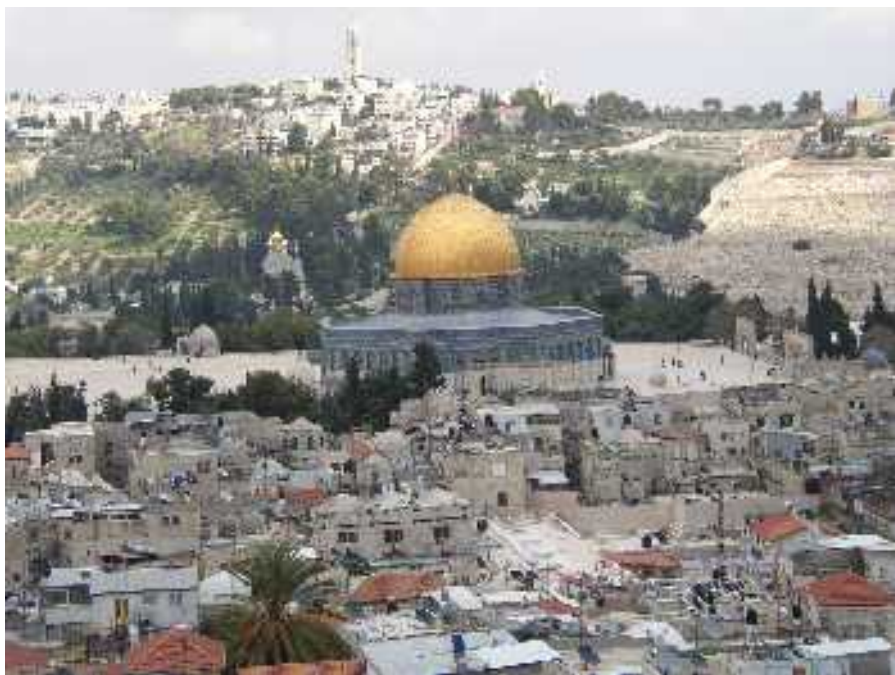
A templomhegy és az Olajfák hegye

Végső sóhajoddal engem / Szabadíts meg, ó, jövel! Ha ezer bűn szól ellenem, / És elítél, ments Te fel! Hogyha végsőt lehel ajkam, / Szent országod megláthassam; Kínod, halálod nekem / Legyen örök életem!