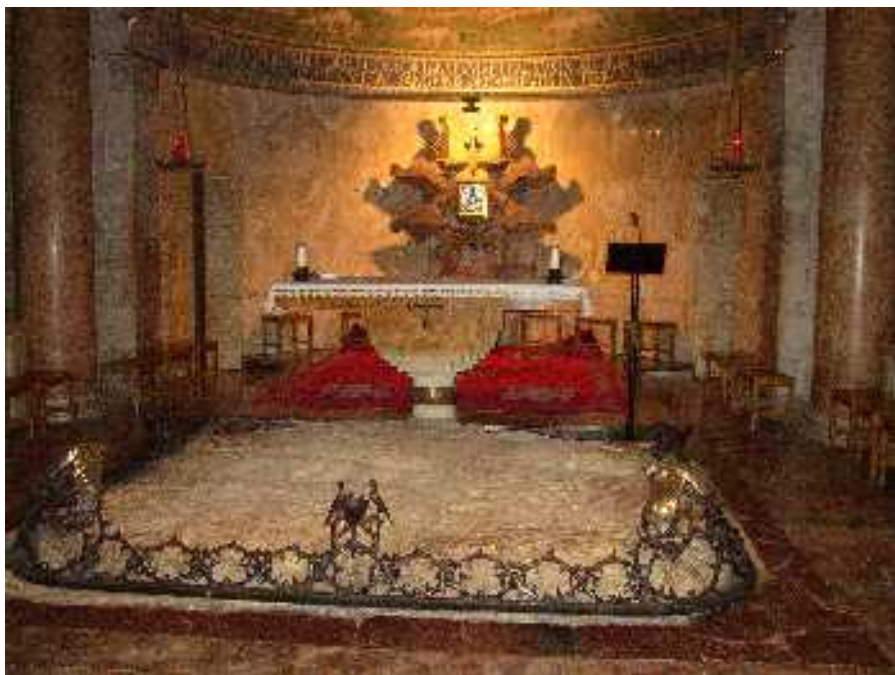
A jeruzsálemi Kínszenvedés templomának oltára a sziklával, amelyen (a hagyomány szerint) Jézus gyötrődött a Gecsemánében

Vigasztaljon gyötrődésed, / Midőn büntudat gyötör, Támogasson csüggedésed, / Kétség, baj reám ha tör. Verejtéked hűvösítsen, / Segítöm, ha senki nincsen; Kérlek, halálod ára / Rajtam ne vesszen kárba!