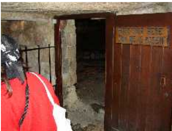
A jeruzsálemi Sírkert sírhelyének ajtófelirata: „Nincs itt, hanem feltámadt.”