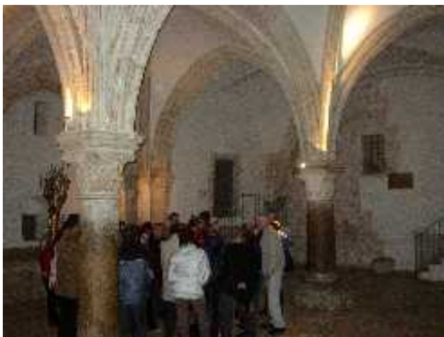
Az utolsó vacsora (hagyomány szerinti) helyszíne a jeruzsálemi zsidó negyedben