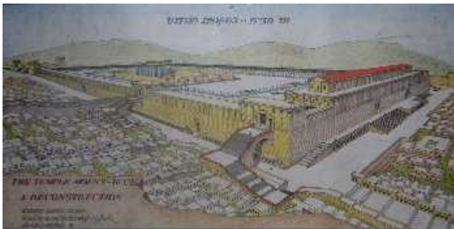
A jeruzsálemi templomhegy rekonstrukciós rajza