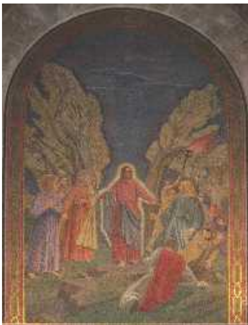
Júdás érkezése — festmény a jeruzsálemi Kinszenvedés templomában

5 Azok pedig így feleltek: „A názáreti Jézust.” „Én vagyok” — mondta Jézus. Ott állt velük Júdás is, aki elárulta Őt. 6 Amikor azt mondta nekik: „Én vagyok” — visszatántorodtak, és a földre estek. 7 Ekkor újra megkérdezte tőlük: „Kit kerestek?” Ők ismét ezt felelték: „A názáreti Jézust.” 8 Jézus így szólt: „Megmondtam nektek, hogy én vagyok: ha tehát engem kerestek, engedjétek ezeket elmenni!” 9 Így kellett beteljesednie annak az ígének,