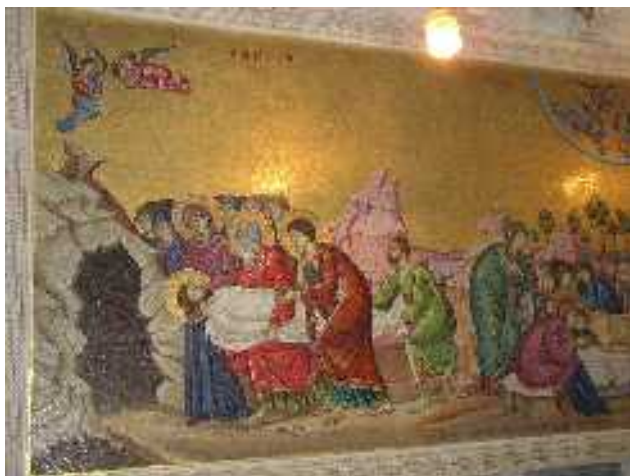
Jézus temetése — mozaik a jeruzsálemi Szent Sír Bazilikában