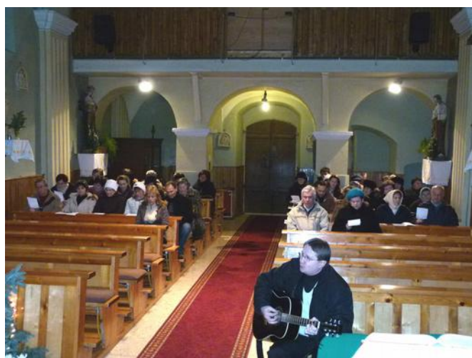
Nőtincsi katolikus templom