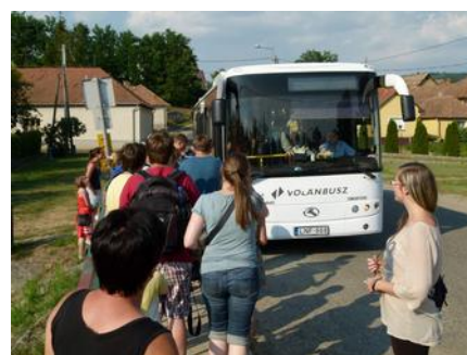
Búcsúzás a buszmegállóban