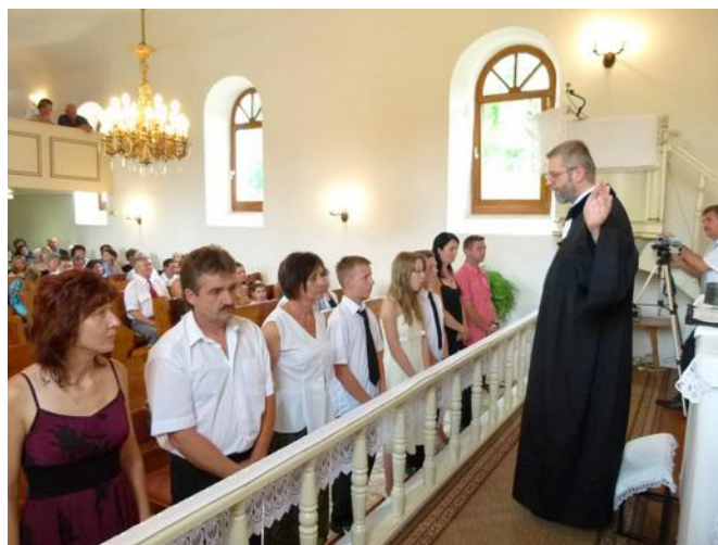
Közös úrvacsora szülőkkel