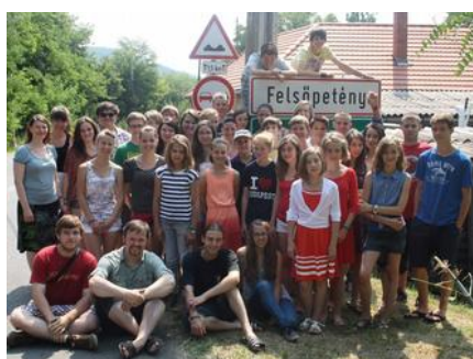
Csoportkép a Felsőpetény táblánál