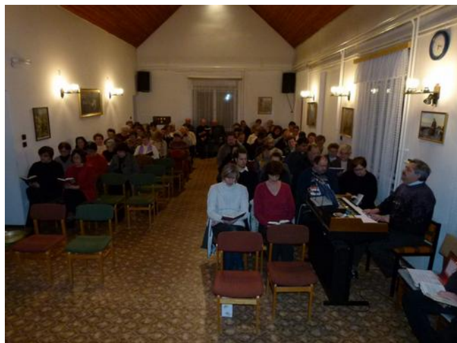
Evangélikus gyülekezeti terem