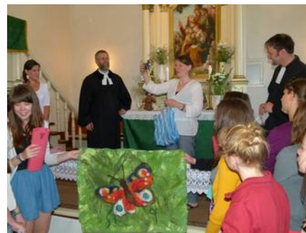
A lützschenaiak átadják ajándékaikat a gyülekezetnek