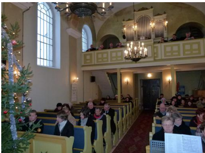
Ipolyvece, evangélikus templom