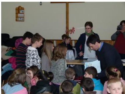
5-6. o. az eredményhirdetéskor