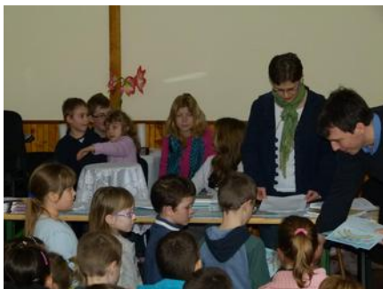
1-2. o. az eredményhirdetéskor