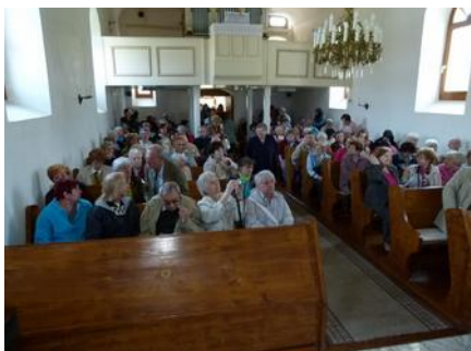
A Pesti Egyházmegye tagjai