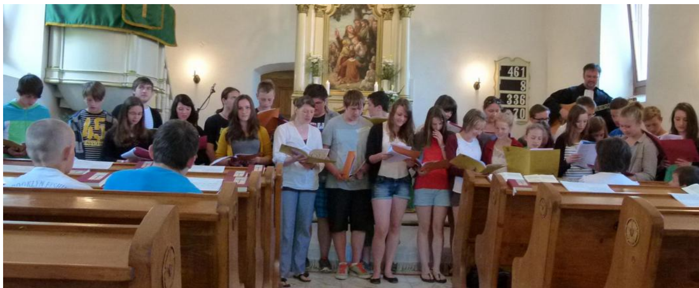
Istentisztelet — a vendégek gitáros éneke