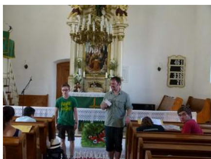
Búcsúzás a templomban