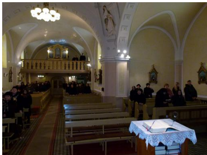
Ipolyvece, római katolikus templom