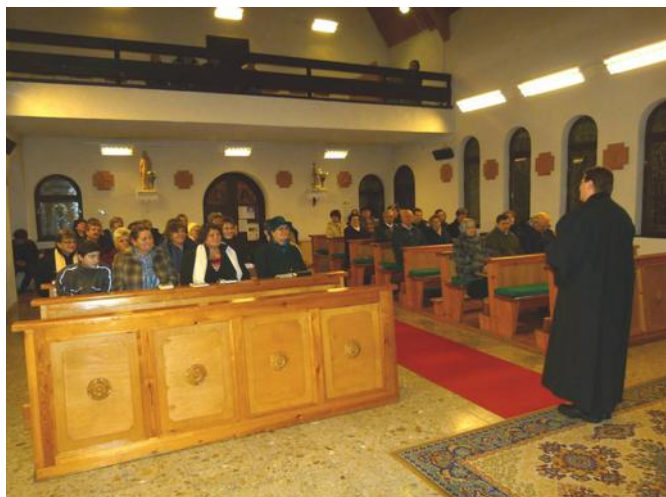
Római katolikus templom