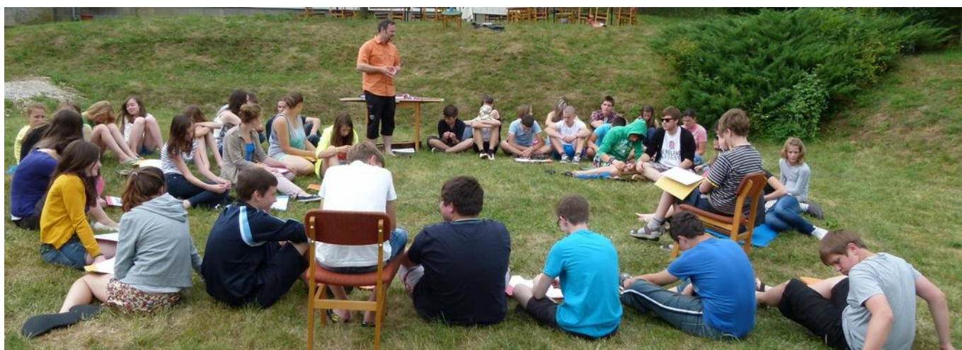
Bibliai foglalkozás a parókiakertben