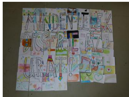
Minden lélek dicsérje az Urat!