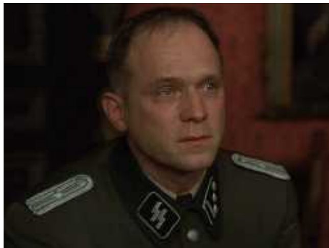
Nem vagyok katolikus...

Nincs mit tenni, a saját lelkésze után egy bíborossal is találkoznia kell, hiszen csak a pápa segíthet, csak ő figyelmeztetheti a közvéleményt. Itt sem marad el a hideg zuhany. A bíboros végső, mindent lesöprő érve egy kérdésbe csomagolva: Ma-ga katolikus? Teljes a kudarc... Van itt még remény bármire? Hát valóban az az egyetlen megoldás, hogy mihamarabb hagyja ott az SS-t?