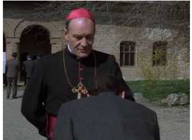
Irgalom a nácinak!

A lelkiismeretet nem is merő orvost persze megmenekül — a zárójelenetben segítséget kap a Vatikántól, hogy Dél-Amerikába mehessen. Hiszen a maga módján ő is hisz Istenben és szimpatizál a keresztyén GERSTEINnel!