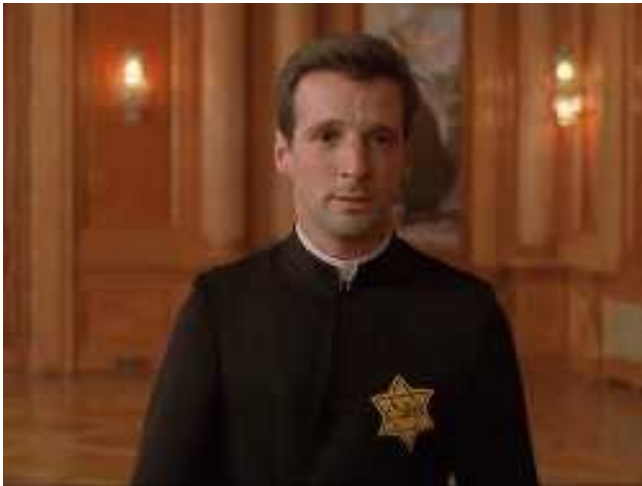
Ha minden keresztyén egy időre zsidóvá válna...

Riccardonak könyörögve sem sikerül meggyőznie a pápát, hogy nem munkatáborokba, hanem kivégezni hurcolják el a zsidókat — immáron Rómából is; annak ellenére is, hogy a németek aranykövetelését teljesítette a zsidó közösség. Nem marad más lehetősége, mint felragyogtatni Dávid csillagát a mellkasán.