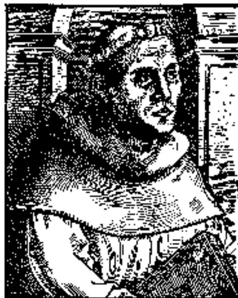
LUTHER — Az egykori Pozsonyi Evangélikus Líceum könyvtárának metszete alapján.

(Sajnos egyházunkban 100 évig nem volt újabb Luther kiadás és fordítás. — Kivételt képeznek hitvallási irataink. — Az 1991-ben újonnan alakult Luther Szövetség az utóbbi években kiadott néhány művet, de természetesen a tetemes méretű LUTHER-életműhöz képest ez igen kevés. A reformáció 400 éves évfordulójára MASZNYIK ENDRE teológiai dékán szerkesztésében jelent meg 6 kötetben eddig a legbővebb kiadás. 2006-ban végre magyarul is megjelent ERIC W. GRAITSCH könyve LUTHERRŐL, az Isten udvari bolondja. E könyvek alapján dolgozom e rovatban.)