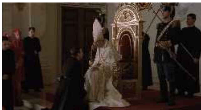
Irgalom a zsidóknak!