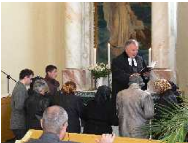
Lelkészi munkaközösségi ülés Ipolyvecén