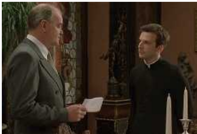
Az amerikai nagykövet győzködése