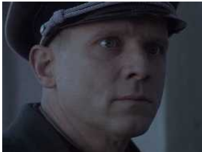
Emberek vegytisztítását láttam!