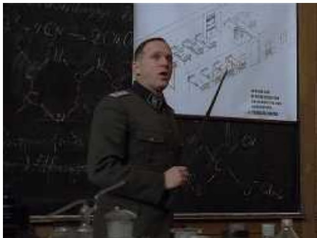
A körlet vegytisztítása

Könnyű elítélni a halálgár 'gázzszolgáltatóját', aki kifejleszti és biztonságosan használhatóvá teszi a ciklon gázt annak érdekében, hogy vele a hadsereg hatékonyan tudjon tisztítani.