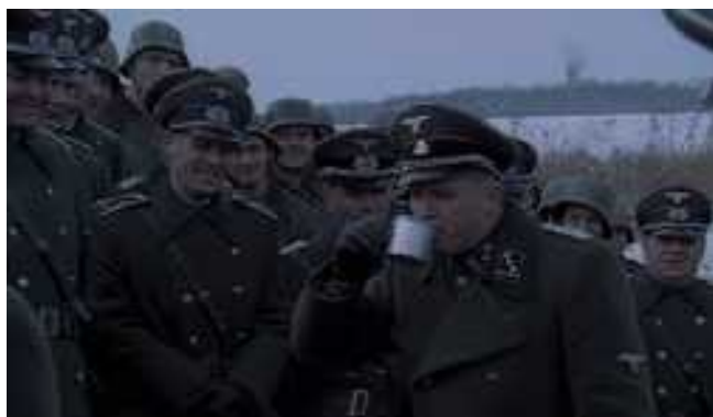
A tisztított víz iható, de íze poccsék

Na de hát miért kellene büntudatot érezzen egy kémiai bravúrja miatt, ami hatékony vegytisztítást tesz lehetővé háborúban álló hazája számára?