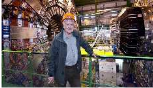
PETER HIGGS a CERN részecskegyorsítójában

Mivel a fizikusok 'játsszodásáról' van szó, vegyük először azt, amit a fizika mondhat e kérdésben. Jó tudnunk először is, hogy a részecskefizika mindig csak valószínűségekkkel dolgozik, abszolút biztos kijelentést éppen ezért senki nem tehet egyetlen egy konkrét esemény kimeneteléről. Azt viszont kijelenthetjük, hogy igen csekély, gyakorlatilag nulla az esélye egy olyan eseménynek, ami pusztulást hozna ránk — olyannyira csekély, hogy miután a nulla mögé teszünk egy veszszót, igen sok nullát (és még eggyel is többet) kellene leírni ahhoz, hogy megkapjuk a fekete lyuk létrejöttének valószínűségét kifejező első számjegyet. Ennél sokkal nagyobb a valószínűsége annak, hogy pl. az utcán járva a fejemre esik egy cserép és agyonüt. Kizárni persze semmit nem lehet, de a nagyon kis valószínűség mégiscsak azt jelenti a hétköznapi fogalmaink terén, hogy nem kell félni tőle.