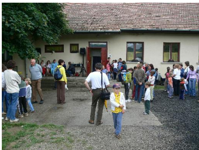
Akadályverseny: eredményhirdetésre várva az iskola udvarán

Keresztút—Levél A Felsőpetényi és Ipolyvecei Evangélikus Gyülekezetek Hírlevele Csak belső használatra!