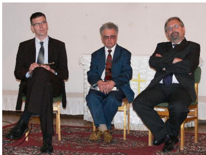
Az előadók (fórumbeszélgetés)