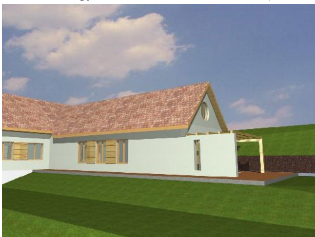
Látványterv — 'C' változat

Sok tanakodás után kiderült, hogy építézetileg a garázs fölé nyúló új épületrész nem megfelelő megoldás, feleslegesen megnövelné a költséget. (Emellett a hely szűkössége folytán csak az ifjúsági szálláshely épületének lebontása árán lenne lehetséges — ezért látványtervet is csak úgy volt hajlandó készíteni a tervező, hogy a régi épület helyén állna egy új, de ugyanúgy külön épületként, nem a gyülekezeti terem toldásaként.)