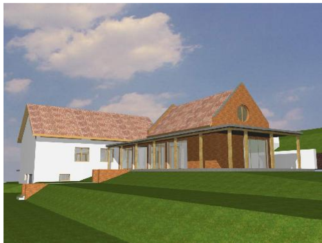
Látványterv — 'A' változat

F ontos pénzügyi esemény történt 2007-ben a felsőpetényi gyülekezet életében: hosszú évek után megkaptuk a hajdani evangélikus iskola államosításkori elvétele miatt a kárpótlási összeget. Ahogyan már tavasszal megtörtént az egyház és az állam közti tárgyalás megállapodása, október végén megérkezett bankszámlánkra a 9,7 millió forintos összeg. Ez teremtette meg a feltételét annak, hogy a gyülekezet régi álma, miszerint szükség van a gyermekek és az ifjúság számára egy külön helyiségre, elindulhasson a megvalósulás útján.