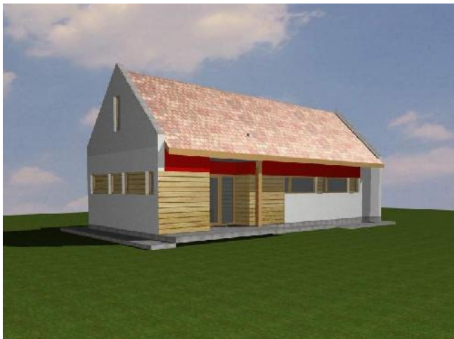
Látványterv — 'B' változat

Sok tanakodás után kiderült, hogy építézetileg a garázs fölé nyúló új épületrész nem megfelelő megoldás, feleslegesen megnövelné a költséget. (Emellett a hely szűkössége folytán csak az ifjúsági szálláshely épületének lebontása árán lenne lehetséges — ezért látványtervet is csak úgy volt hajlandó készíteni a tervező, hogy a régi épület helyén állna egy új, de ugyanúgy külön épületként, nem a gyülekezeti terem toldásaként.)