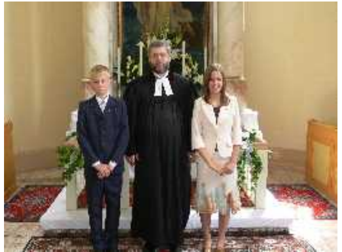
Bibliai Nap Felsőpetényben: