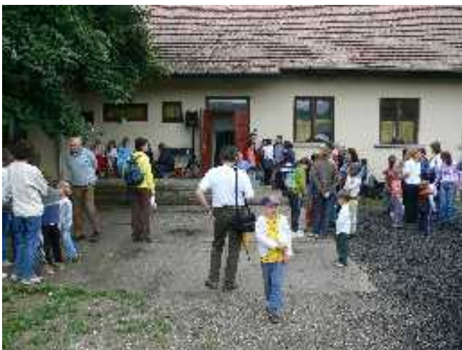
Akadályverseny: eredményhirdetésre várva az iskola udvarán

Keresztút—Levél A Felsőpetényi és Ipolyvecei Evangélikus Gyülekezetek Hírlevele Csak belső használatra!