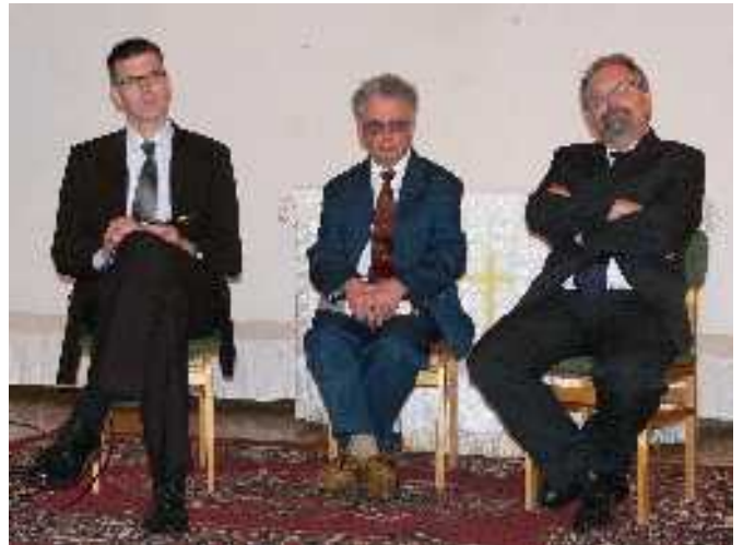
Az előadók (fórumbeszélgetés)