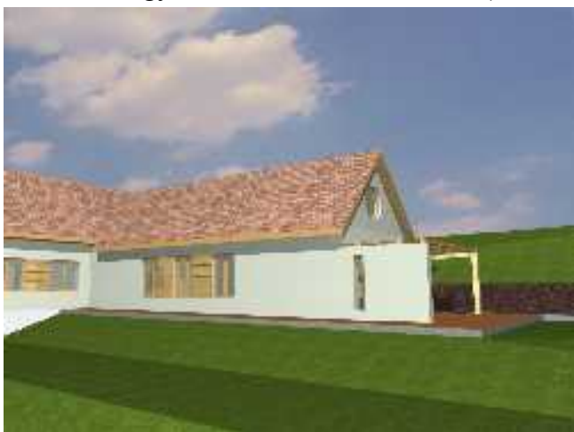
Látványterv — 'C' változat

Sok tanakodás után kiderült, hogy építézetileg a garázs fölé nyúló új épületrész nem megfelelő megoldás, feleslegesen megnövelné a költséget. (Emellett a hely szűkössége folytán csak az ifjúsági szálláshely épületének lebontása árán lenne lehetséges — ezért látványtervet is csak úgy volt hajlandó készíteni a tervező, hogy a régi épület helyén állna egy új, de ugyanúgy külön épületként, nem a gyülekezeti terem toldásaként.)