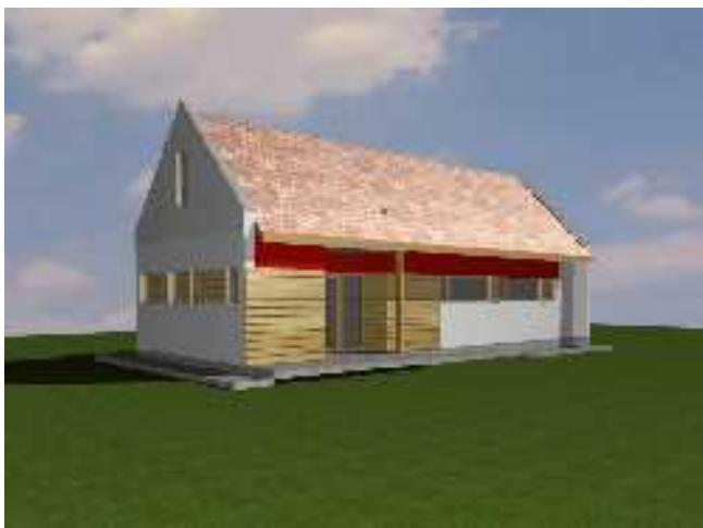
Látványterv — 'B' változat

Sok tanakodás után kiderült, hogy építézetileg a garázs fölé nyúló új épületrész nem megfelelő megoldás, feleslegesen megnövelné a költséget. (Emellett a hely szűkössége folytán csak az ifjúsági szálláshely épületének lebontása árán lenne lehetséges — ezért látványtervet is csak úgy volt hajlandó készíteni a tervező, hogy a régi épület helyén állna egy új, de ugyanúgy külön épületként, nem a gyülekezeti terem toldásaként.)