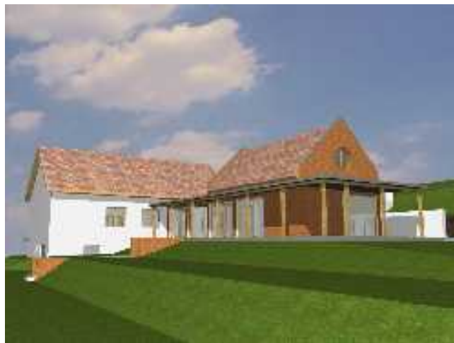
Látványterv — 'A' változat

F ontos pénzügyi esemény történt 2007-ben a felsőpetényi gyülekezet életében: hosszú évek után megkaptuk a hajdani evangélikus iskola államosításkori elvétele miatt a kárpótlási összeget. Ahogyan már tavasszal megtörtént az egyház és az állam közti tárgyalás megállapodása, október végén megérkezett bankszámlánkra a 9,7 millió forintos összeg. Ez teremtette meg a feltételét annak, hogy a gyülekezet régi álma, miszerint szükség van a gyermekek és az ifjúság számára egy külön helyiségre, elindulhasson a megvalósulás útján.