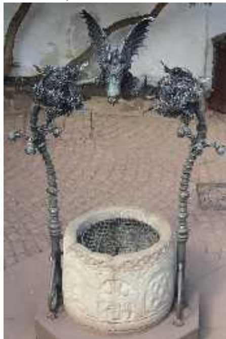
Kút Wartburg várában