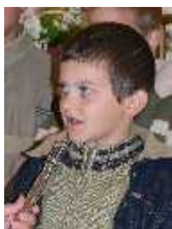
Anyák napja Felsőpetényben: