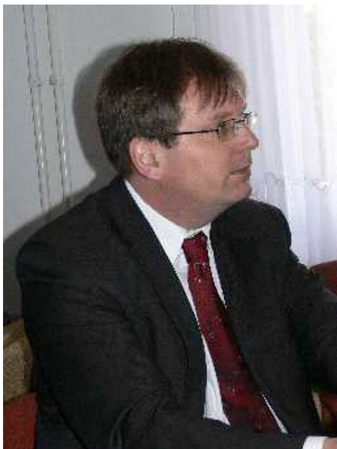
FABINY TAMÁS püspök látogatása a felsőpetényi gyülekezetben