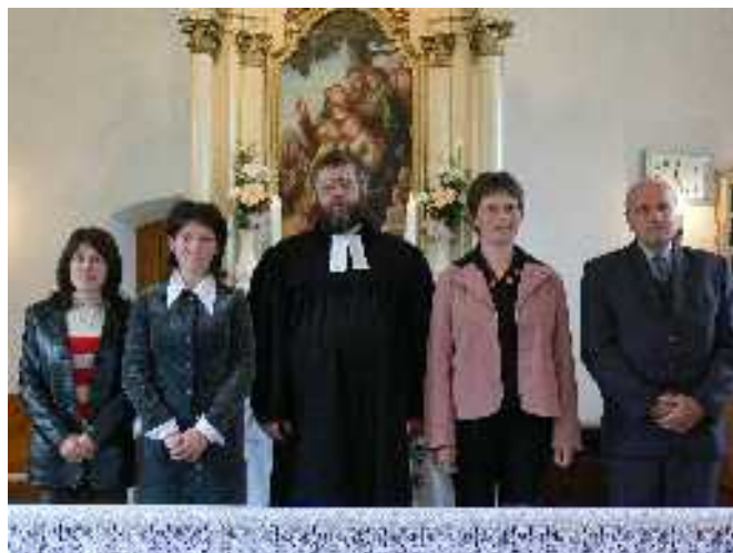
Áttérési ünnepség Felsőpetényben