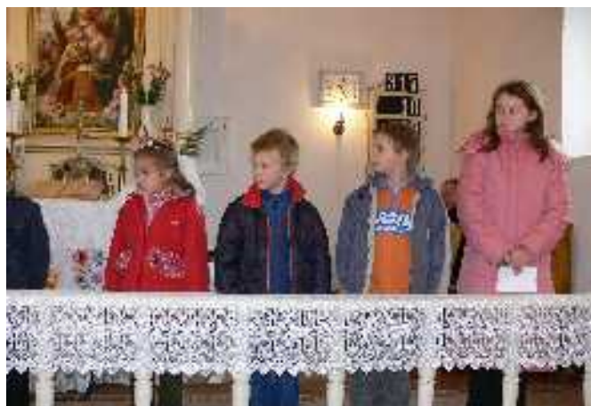
Templomszentelési ünnep Felsőpetényben