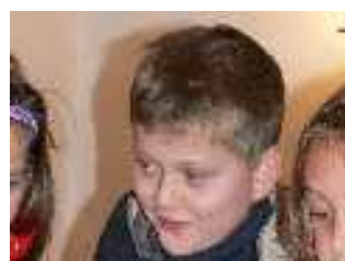
Karácsonyi színdarab Felsőpetényben: