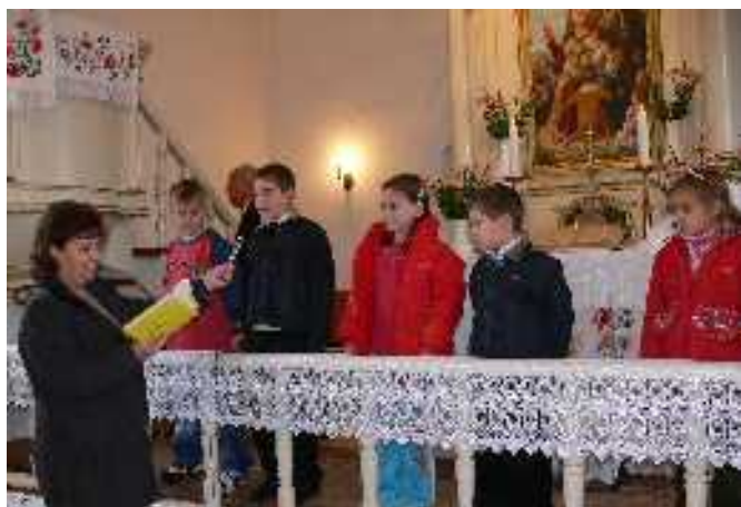
Templomszentelési ünnep Felsőpetényben

Utolsó rovatunk célja, hogy a beszámolók, cikkek alkalmával elő nem került képek segítségével további betekintést nyújtson gyülekezeteink életébe, az elmúlt időszak eseményeibe.